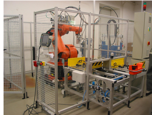
Celkový pohled na pracoviště