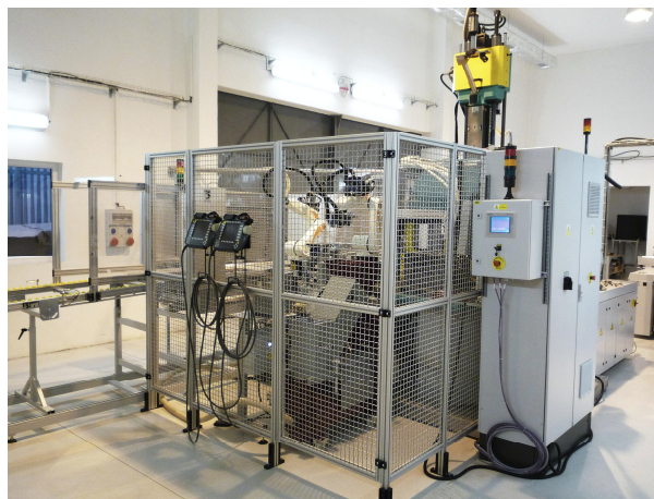
Celkový pohled na pracoviště