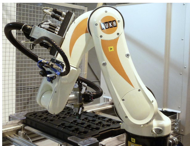
Robot A – manipulace s díly v zakládací paletě