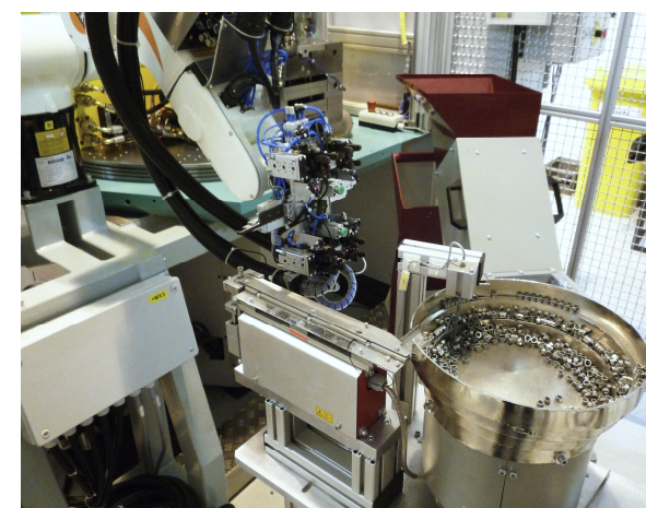
Chapadlo robota B a vibrační zásobník