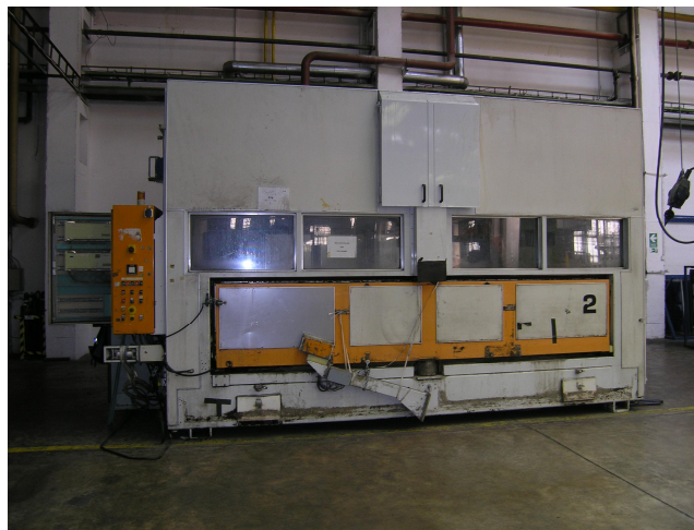
Kabina ABB před rekonstrukcí