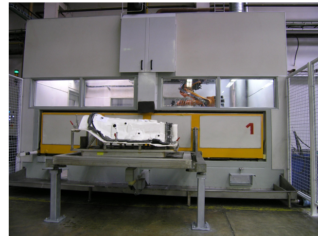
Kabina po rekonstrukci s robotem KUKA