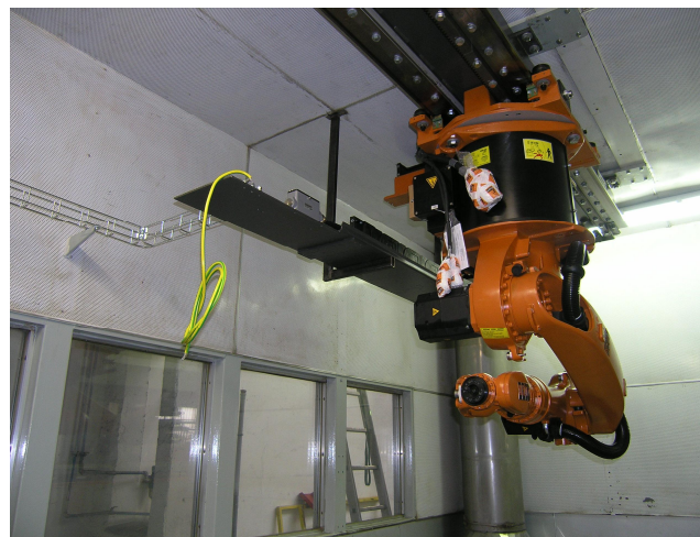
Robot KUKA na lineárním pojezdu