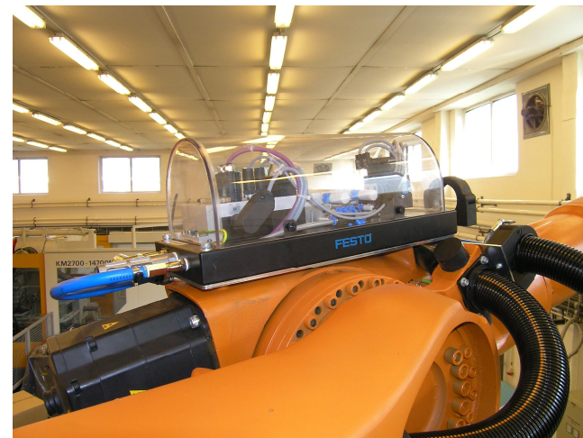
Ventilová baterie FESTO