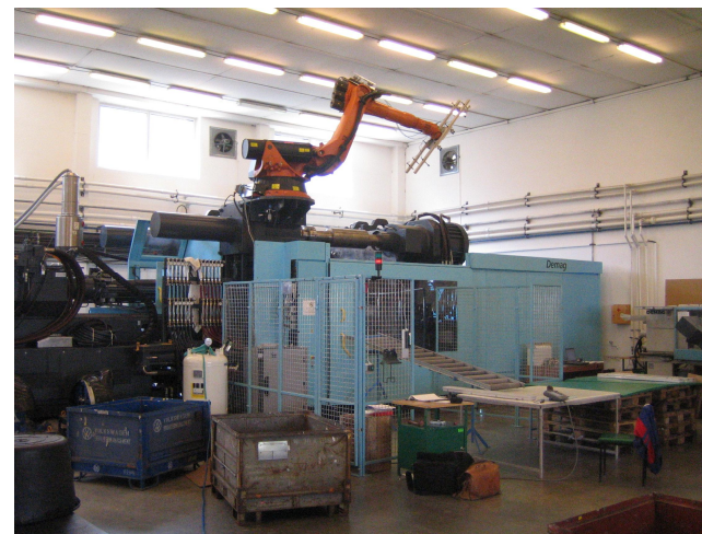
Celkový pohled na pracoviště