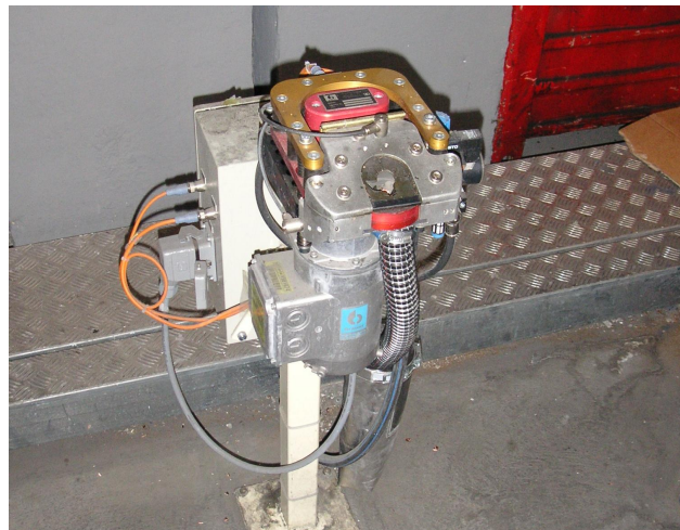
Fräser von Kappen