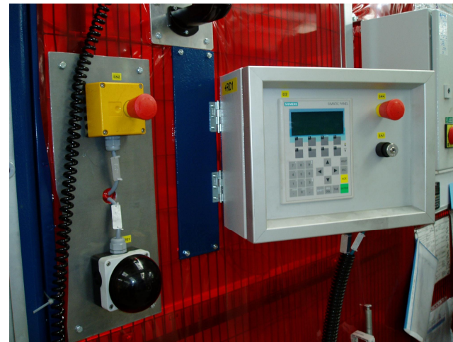
Schaltkasten mit Bedienpult OP77