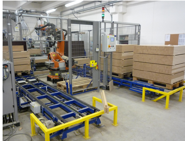
General view on the workplace