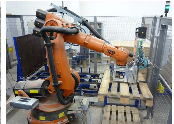
Manipulation with an EUR pallet