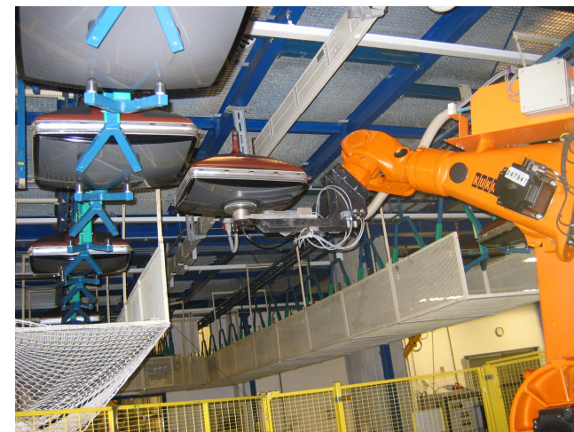
Робот для разрядки