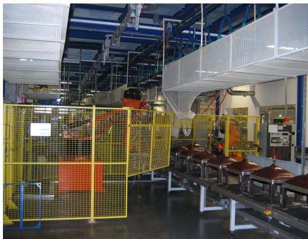
Конвейеры – общий вид