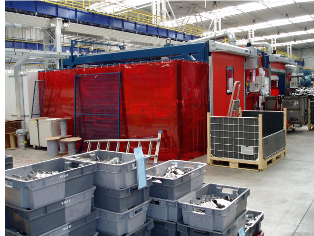
Общий вид на рабочее место